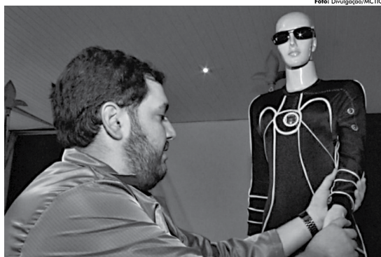
Orientado por estímulos táteis a partir de sinais de sensores resistentes ao atletismo, corredor gerterá autonomia

giroscópios e acelerômetros a fibra óptica, para que possa se tornar um produto operacional.