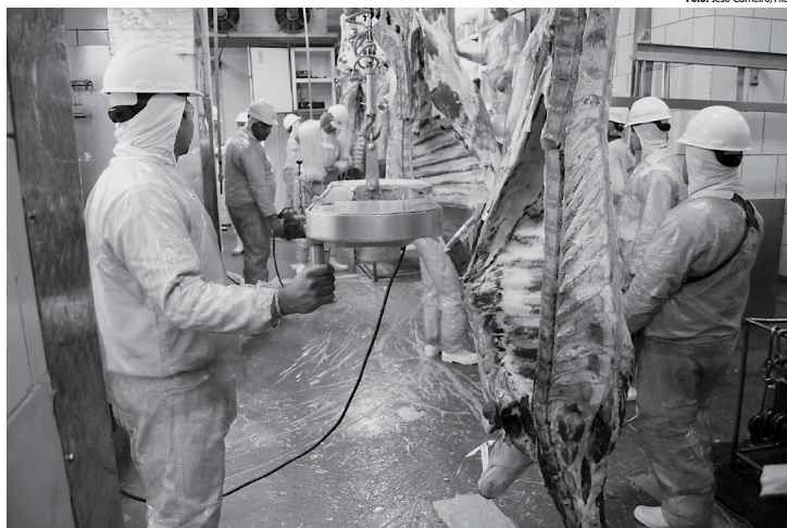
A lista dos frigoríficos auditados estará disponível para consulta da população no site do Ministério da Agricultura, Pecuária e Abastecimento

A Operação Carne Fraca, da Polícia Federal, foi de-